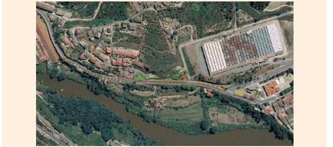
Implementación de la propuesta en el territorio